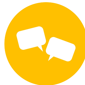
Encontros e Diálogos