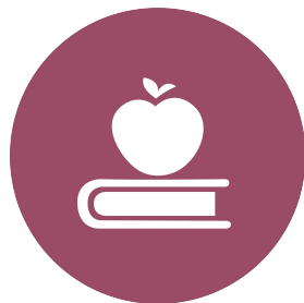
Educação e Permacultura

Trabalhamos com a transformação de pessoas e espaços, através dos princípios da permacultura, para a construção de sociedades sustentáveis.